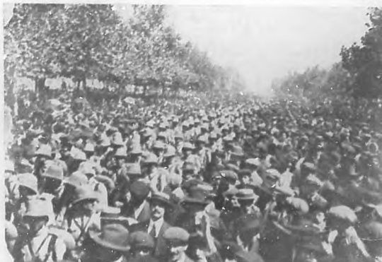
LA GUERRA EUROPEA.—Tropas portuguesas desfilando por la Avenida de la Libertad en correcta formación, en medio del entusiasta clamoreo del público.

La nota más sensacionalmente grande, por su dolor y su tristeza, que nos ha transmitido el cable y después con abun-