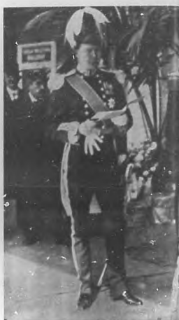
LA GUERRA EUROPEA.—El Duque de Westminster, condecorado por sus actos heroicos en la actual campaña.

dantes detalles nos han relatado los periódicos, ha sido la gran manifestación de los veteranos franceses efectuada el 10