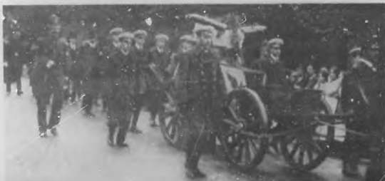
LA GUERRA EUROPEA.—Funerales navales de los aviadores británicos, muertos al servicio de la Patria, saliendo del "Hendon Aerodrome".