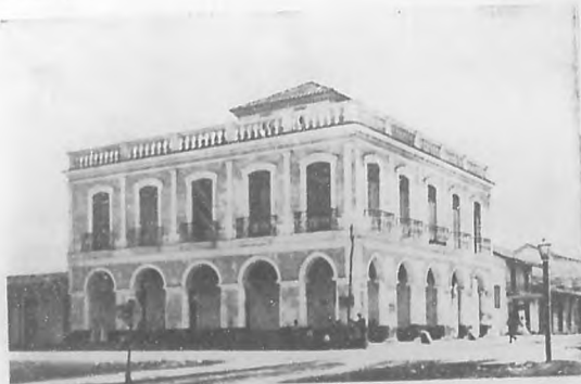
LA ADUANA DE CAIBARIÉN

Los salones se vieron inundados por una pléyade de bellas damas y damitas.