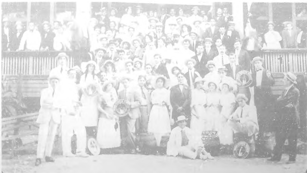
Grupo de concurrentes al almuerzo con que la Cervecería "La Tropical" obsequió a las camaratas y dependientes de cafés de la Habana, el día 13 del actual.—Fotografía tomada en el restaurant situado en "La Tropical"