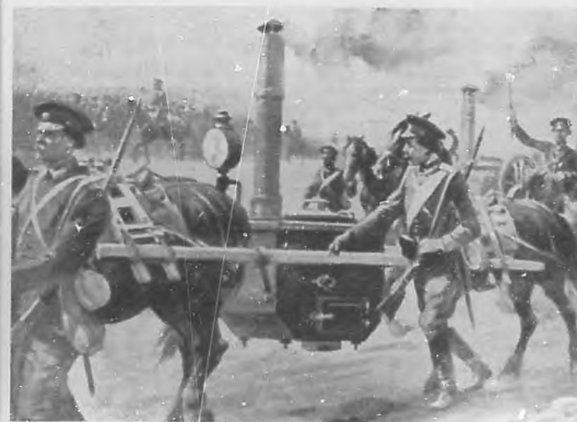
LA GUERRA EUROPEA.—Cocina de campaña que usa el ejército inglés en la actual contienda.

de Agosto, ante el monumento de Estrasburgo, en París, del cual publicamos una interesante fotografía.