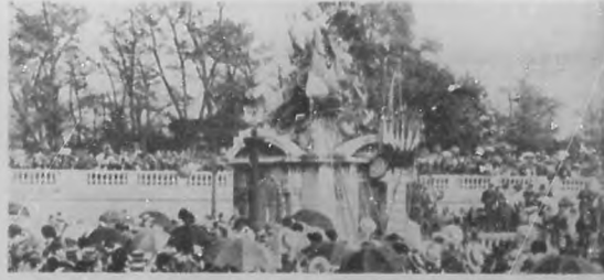
LA GUERRA EUROPEA.—Los veteranos de Francia, despojando del luto con que durante cuarenta y cuatro años ha permanecido cubierta la estatua "Estrasburgo", el 10 de Agosto de 1914, cubriéndola de flores.