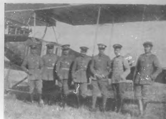
LA GUERRA EUROPEA.—Aviadores del ejército alemán, que han sido condecorados con la Cruz de Hierro.

En París ha permanecido la estatua de Estrasburgo cubierta de luto, de crespones de dolor, por espacio de cuarenta y cuatro años. Época de vmezcruenta de un pueblo en sus dulces arrobos y deliquios con la libertad. El dolor en concreción de bochorno y angustia en la dureza de la piedra y el bronce. La impotencia muda y abe-