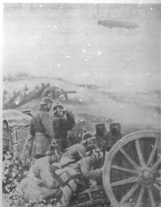
LA GUERRA EUROPEA.—Un Zeppelin señalando a la artillería alemana la posición del ejército enemigo.