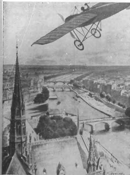
LA GUERRA EUROPEA.—Aeroplano alemán, volando sobre París, (Francia).

El corazón de los viejos soldados no ha cantado el himno de los héroes, ha dado una lección al mundo de que unos trapos y unas flores son la vida del alma nacional. Y para la vida no hay sino sangre.