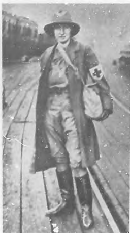
LA GUERRA EUROPEA.—Una señorita de la buena sociedad de Inglaterra, prestando servicios en la Cruz roja del ejército aliado.