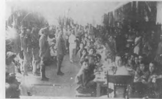
LOS EXPLORADORES EN MATANZAS.—Aspecto del almuerzo ofrecido en el Cuartel "Agramonte, por los Jefes y Oficiales del Regimiento número 2.