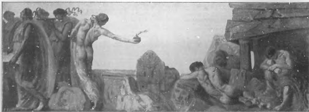
LA GUERRA EUROPEA.—Famoso relieve del pabellón inglés en la Exposición de Lipsia, destrozado por los alemanes.