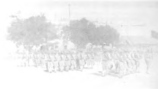
Grupo de concurrentes al almuerzo con que la Cervecería "La Tropical" obsequió a las camaratas y dependientes de cafés de la Habana, el día 13 del actual.—Fotografía tomada en el restaurant situado en "La Tropical"